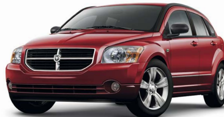
Inferno Red Metallic